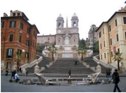
Plaza de España, en Roma.

comercial y el resto constituye 317 viviendas (=logements). Llama la atención su gran escalinata (=perron), que recrea la Plaza de España de Roma, en Bilbao.